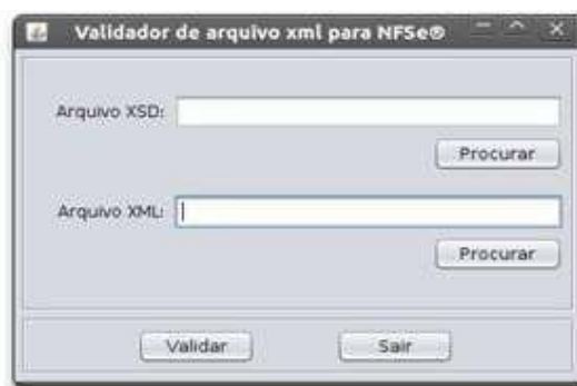
Figura 3: Tela inicial do Validador

Para realizar esta validação, a Prefeitura coloca à disposição uma aplicação chamada “Validador de Schema”, compatível com todas as plataformas atuais. A Figura 3 a seguir mostra a tela inicial desta aplicação.