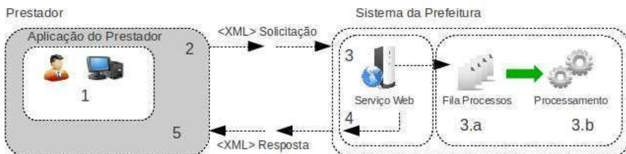
Figura 2: Fluxo de serviço Web assíncrono

As solicitações de serviços de implementação assíncrona são processadas de forma distribuída por vários processos e o resultado do processamento somente é obtido na segunda conexão. Na Figura 2 a seguir tem-se o fluxo simplificado de funcionamento: