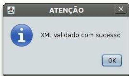
Figura 4: Janela indicando sucesso da validação do XML

Depois de indicados os arquivos e se clicar no botão “Validar”, a aplicação irá confrontar o arquivo XML com as definições do XML Schema. Caso a validação seja concluída com sucesso, aparecerá a janela mostrada na Figura 4 a seguir.